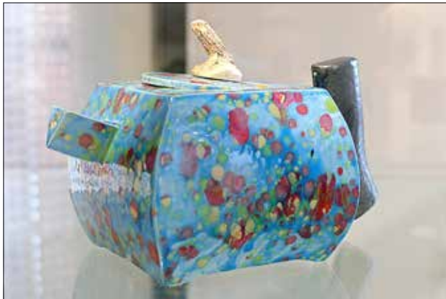
Werk des Keramikvereins tonART

Fragen zu den ausgestellten Arbeiten werden gern unter 0157 32587181 beantwortet.