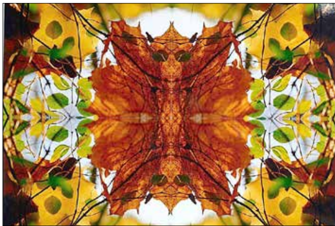
Fotografie zum Thema „Ornamentik oder die Kunst der Verzeihung“ – eine Herbstnachlese.