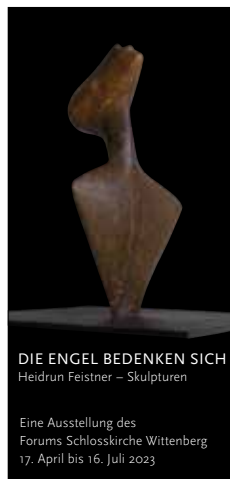
DIE ENGEL BEDENKEN SICH Heidrun Feistner – Skulpturen

Der Engel der Geschichte – zwischen Klee und Benjamin und zwischen Vergangenheit und Zukunft