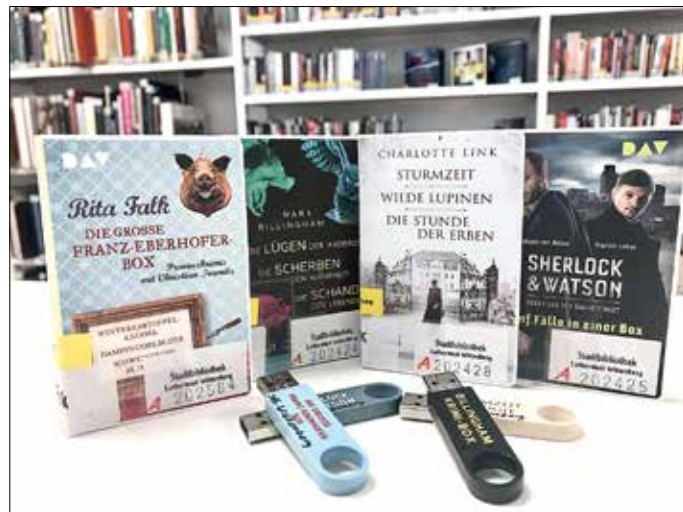
Auswahl an Mobi Hörsticks