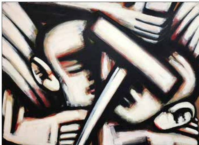
„geteilte hoffnung“ Acryl auf Leinwand (2020)

Hans-Hendrik Grimmlings Ausstellung „geteilte Hoffung II“ ist bis zum 01.11.2023 im Kunst.Wittenberg zu den Öffnungszeiten des Alten Rathauses zu sehen.