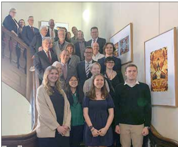
Teilnehmer*innen des Empfangs anlässlich des Partnerschaftsjubiläums