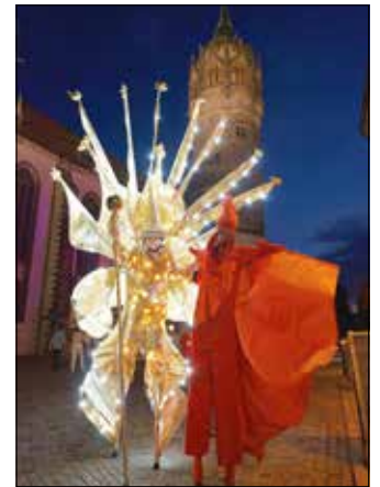
Lichtzauber und Feuervogel

Eine riesige Bandbreite an musikalischen und kulturellen Acts versprechen einen erlebnisreichen Abend. Großartige und interessante Ausstellungen erwarten die nächtlichen Gäste. Es ist die Nacht, in der die Museen und Galerien unserer Stadt neu entdeckt werden können und in vielen Höfen und Gebäuden die besonderen Klänge dieses unvergleichlichen Abends zu hören sein werden. Die Nacht in der die Besucher*innen Staunen, Lachen, Genießen, Zuhören und vieles Neues erleben können – Die Wittenberger Erlebnismacht.