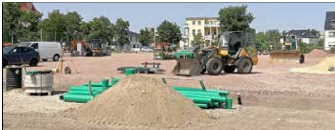
Umbauarbeiten am Platz der Jugend

Seit Ende November 2022 laufen die Bauarbeiten zum Umbau des alten Tennenplatzes am Platz der Jugend zu einem modernen Kunstrasenplatz. Da der Anfang der 90er-Jahre errichtete Sportplatz nicht mehr den heute gültigen Anforderungen einer modernen Trainingsstätte entsprach, wurde der Platz – inklusive Flutlichtanlage, Ballfangzäune, Barrieren, Tore, Bordanlagen und Pflasterbeläge – noch zum Ende des letzten Jahres vollständig zurückgebaut. Im März 2023 konnten die Bauarbeiten nach witterungsbedingter Pause wieder aufgenommen werden. Seitdem wurden beispielsweise zwei Regenwasserzisternen mit einem Fassungsvermögen von jeweils 20 m³, das Rigolen- und Drainagesystem sowie die Pumpen- und Steuertechnik für die Beregnungsanlage des Platzes eingebaut. Zuletzt wurden unter anderem die sechs Stahlbeton-Fundamente für die 16 Meter hohen Flutlichtmasten angelegt sowie die Fundamente für die 6 Meter hohen Ballfangzäune gesetzt.