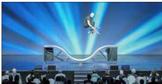
Die Rollschuh-Show