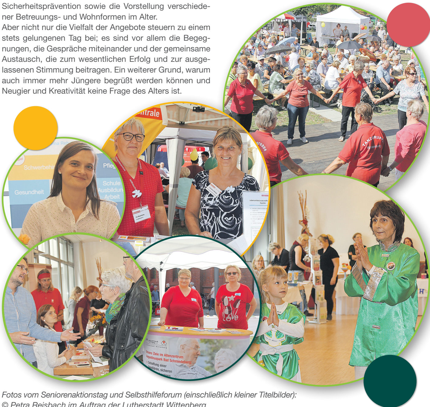
Fotos vom Seniorenaktionstag und Selbsthilfeforem (einschließlich kleiner Titelbilder): © Petra Reisbach im Auftrag der Lutherstadt Wittenberg

Dann wenden Sie sich bitte an die Kontaktstelle für Selbsthilfegruppen, soziale Vereine und Initiativen der Lutherstadt Wittenberg (s. Seite 2).